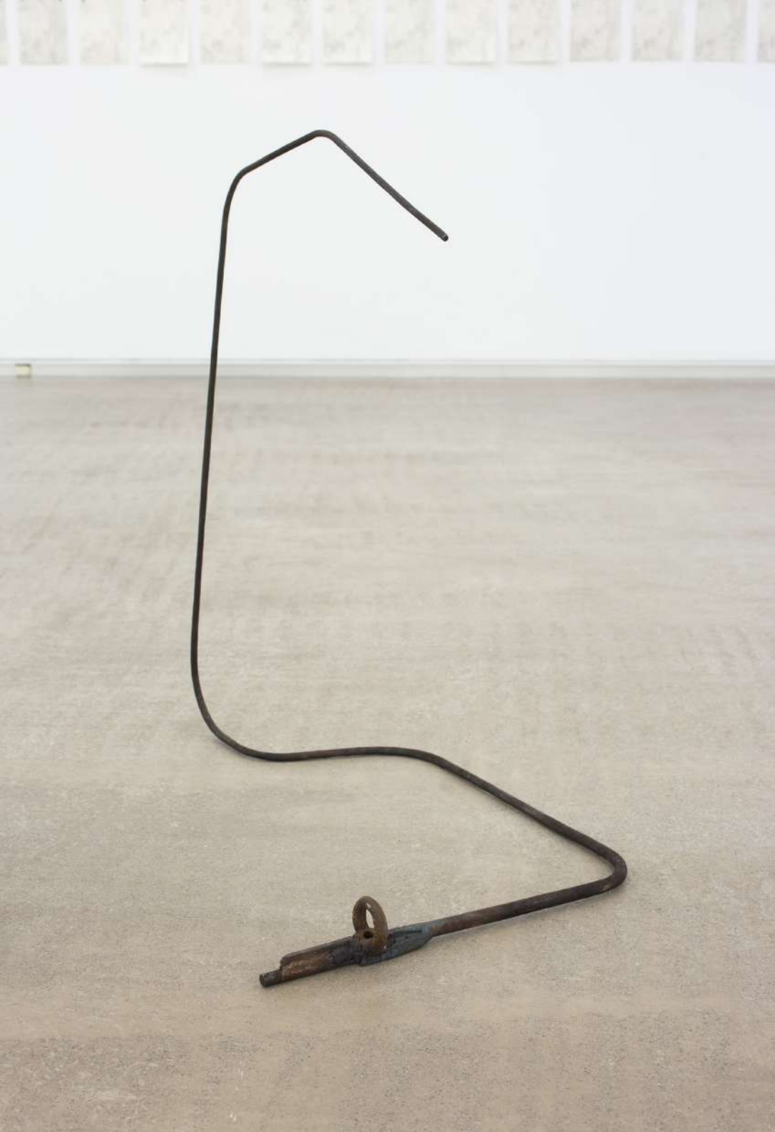
Bellota (1) , 2020 Acero forjado. 93 x 93 x 55 cm.