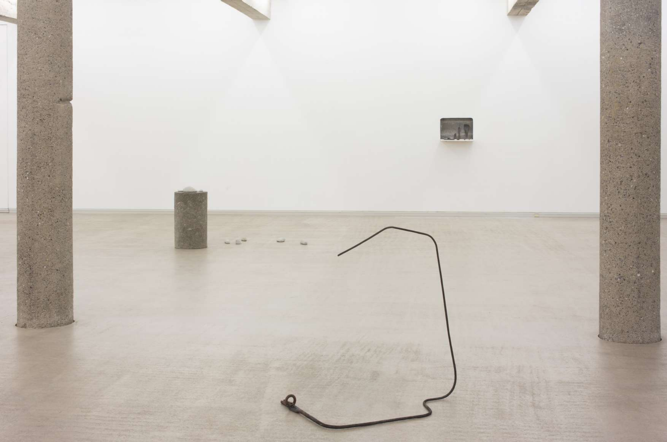
Imagen de instalación