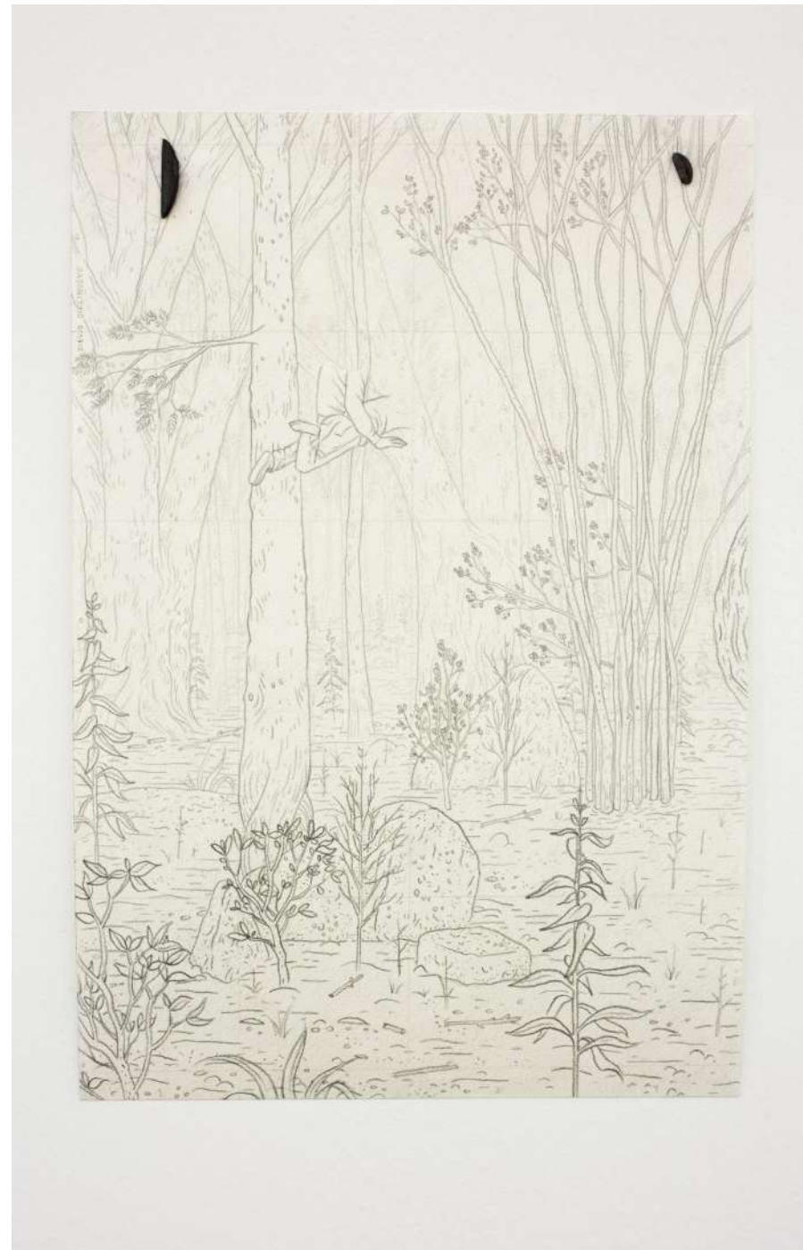
Chamarra negra, sudadera gris, 2020 Políptico 22 dibujos. Lápiz sobre papel, imanes, fragmentos de acero. 29,7 x 21 cm. c/u, medida variable de la instalación. (detalles)