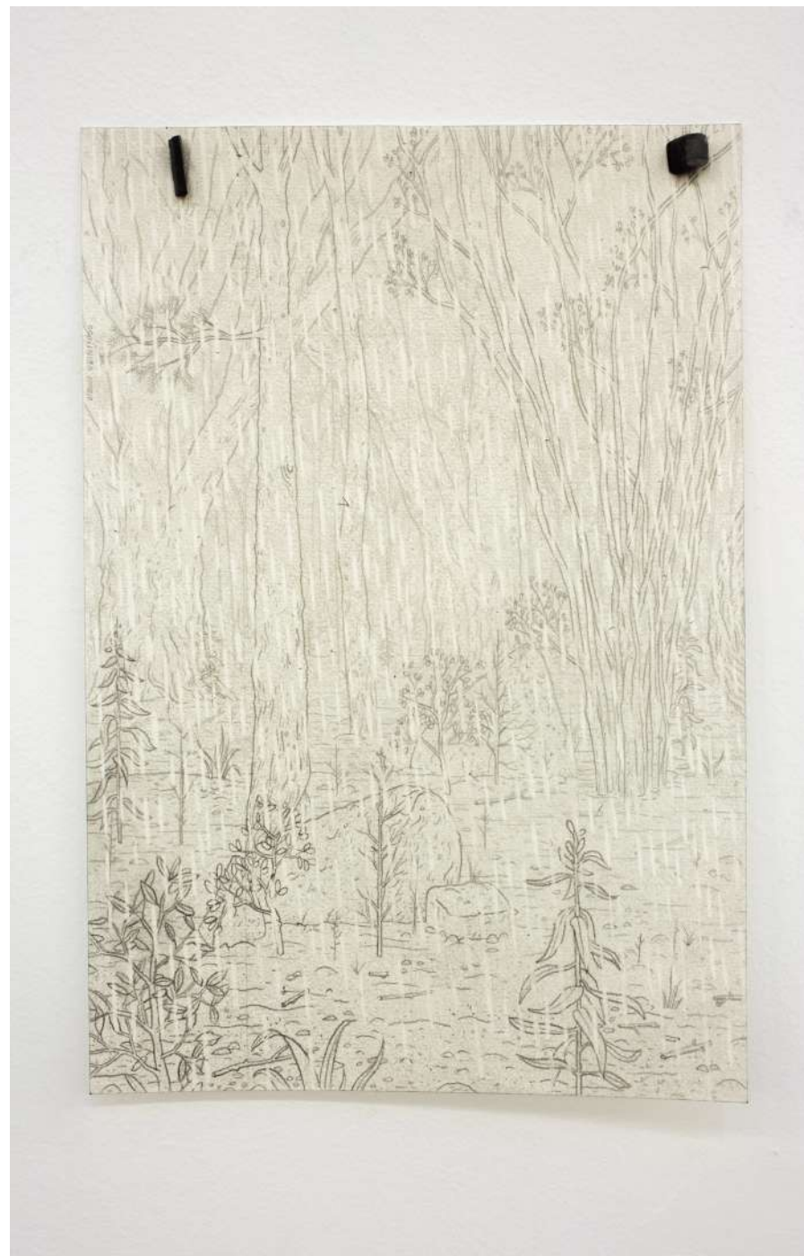
Chamarra negra, sudadera gris, 2020 Políptico 22 dibujos. Lápiz sobre papel, imanes, fragmentos de acero. 29,7 x 21 cm. c/u, medida variable de la instalación. (detalles)