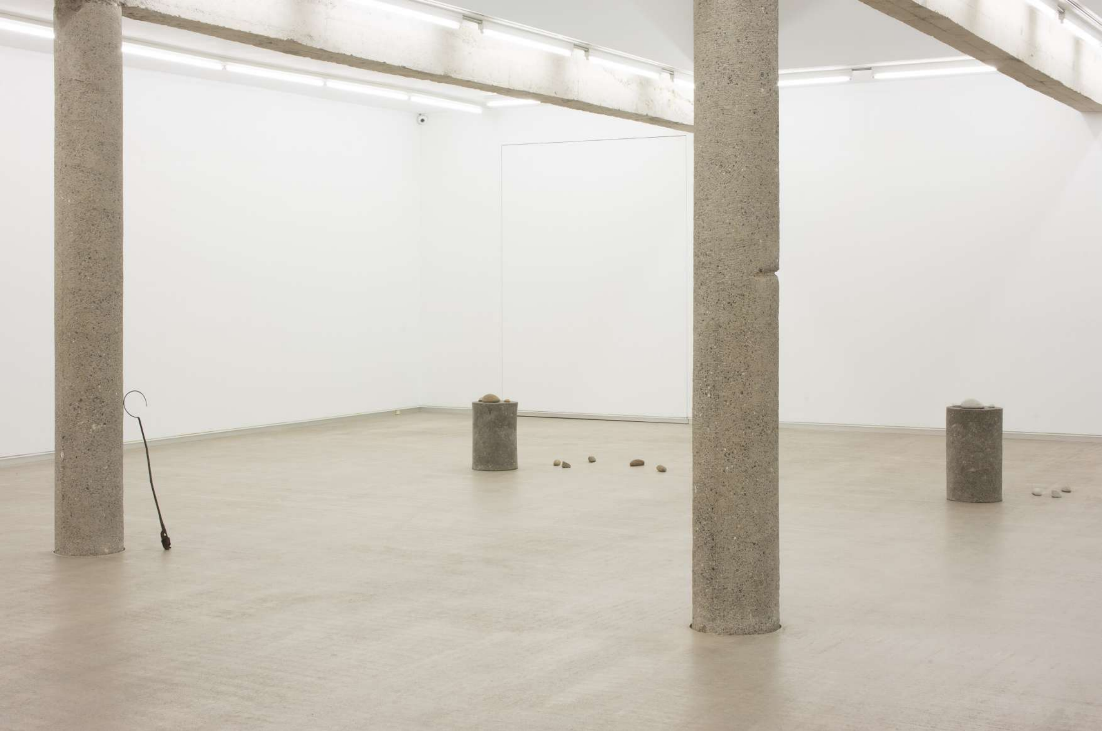
Imagen de instalación