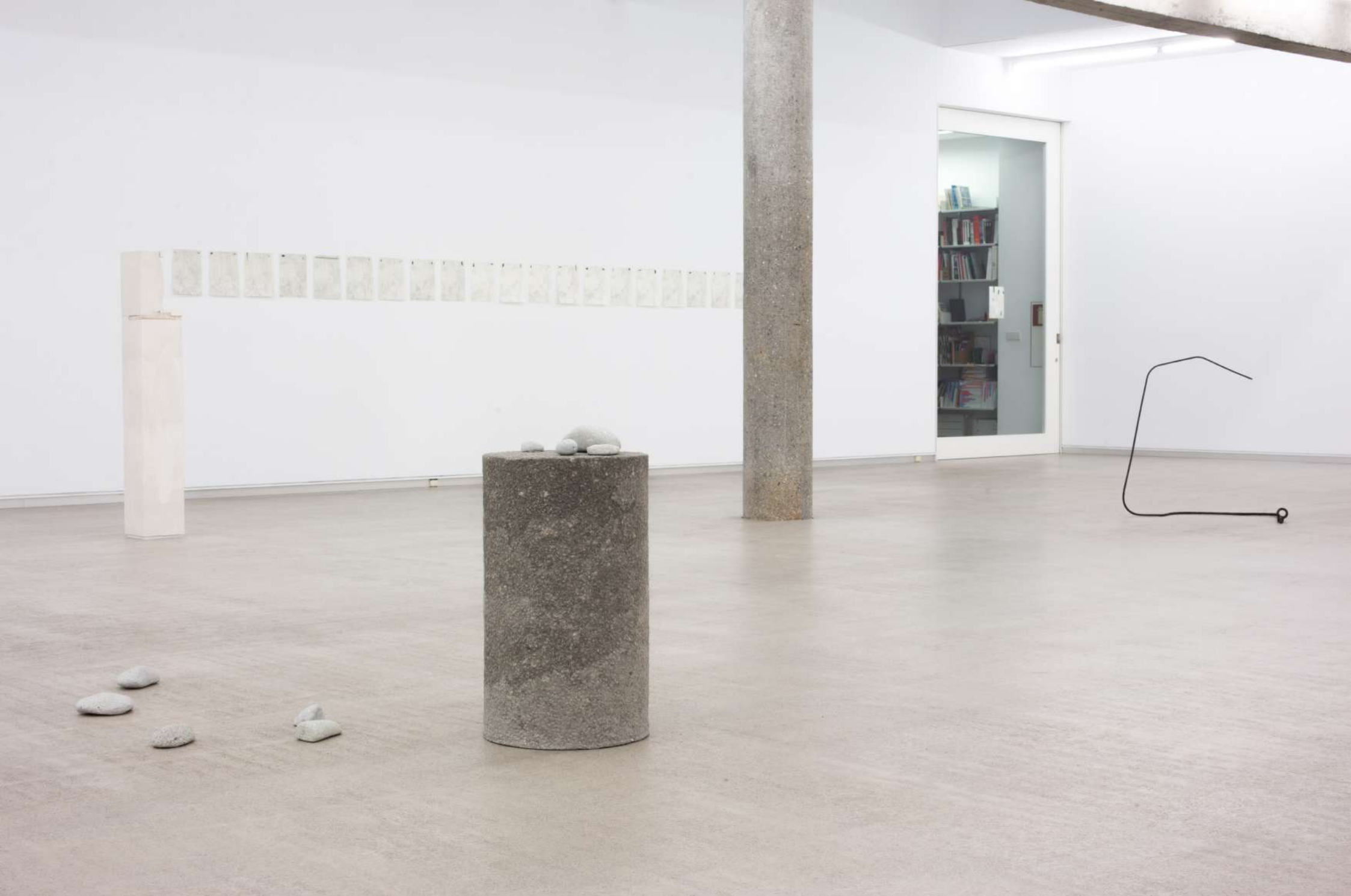
Imagen de instalación