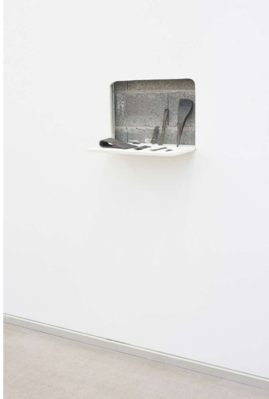
Hachita , 2020 Acero forjado y fundición en acero. 8 elementos. 37 x 53 x 37 cm.