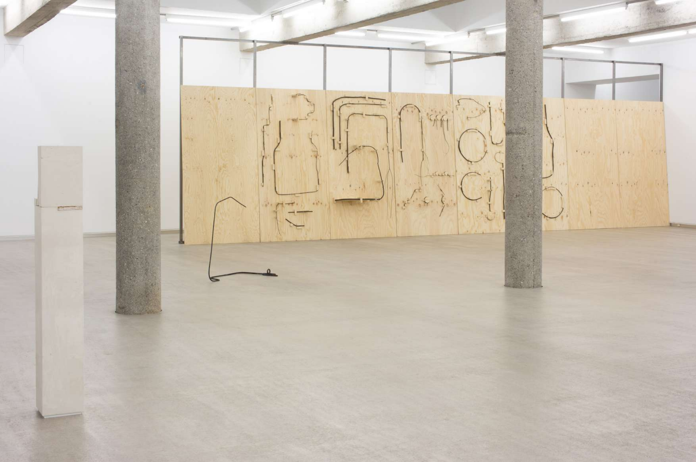
Imagen de instalación