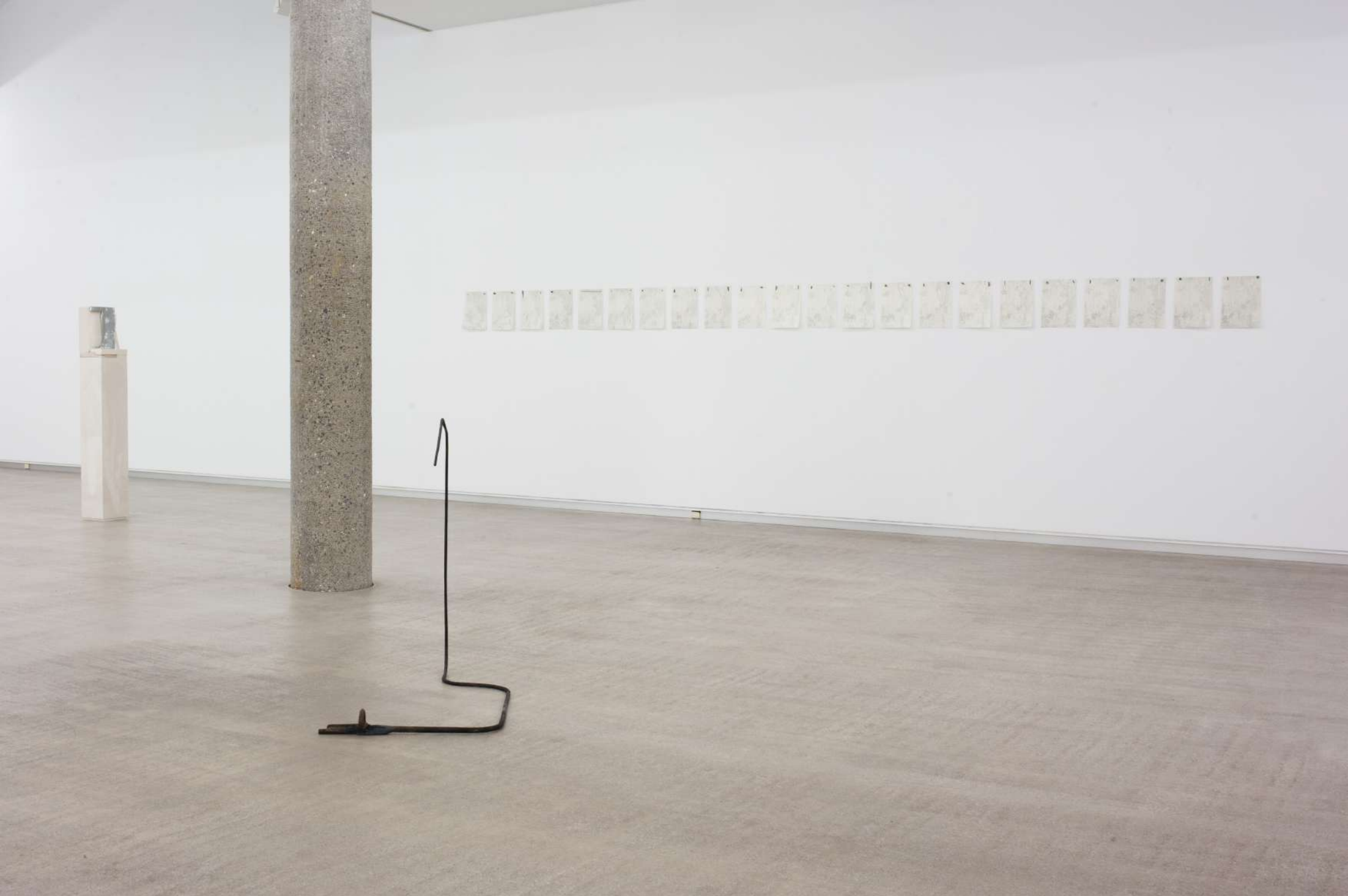
Imagen de instalación