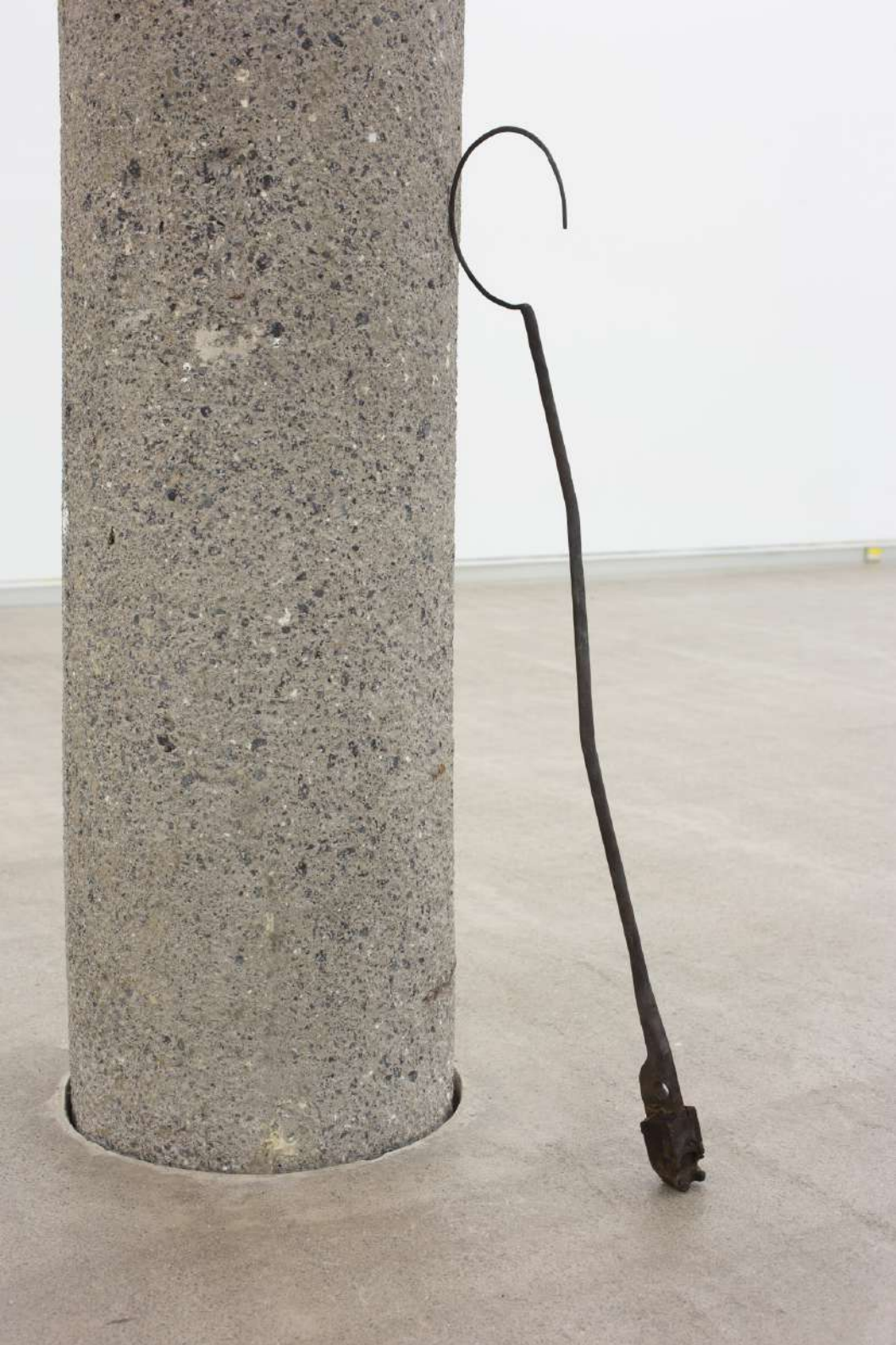
Bellota (3) , 2020 Acero forjado. 98 x 16 x 4 cm.