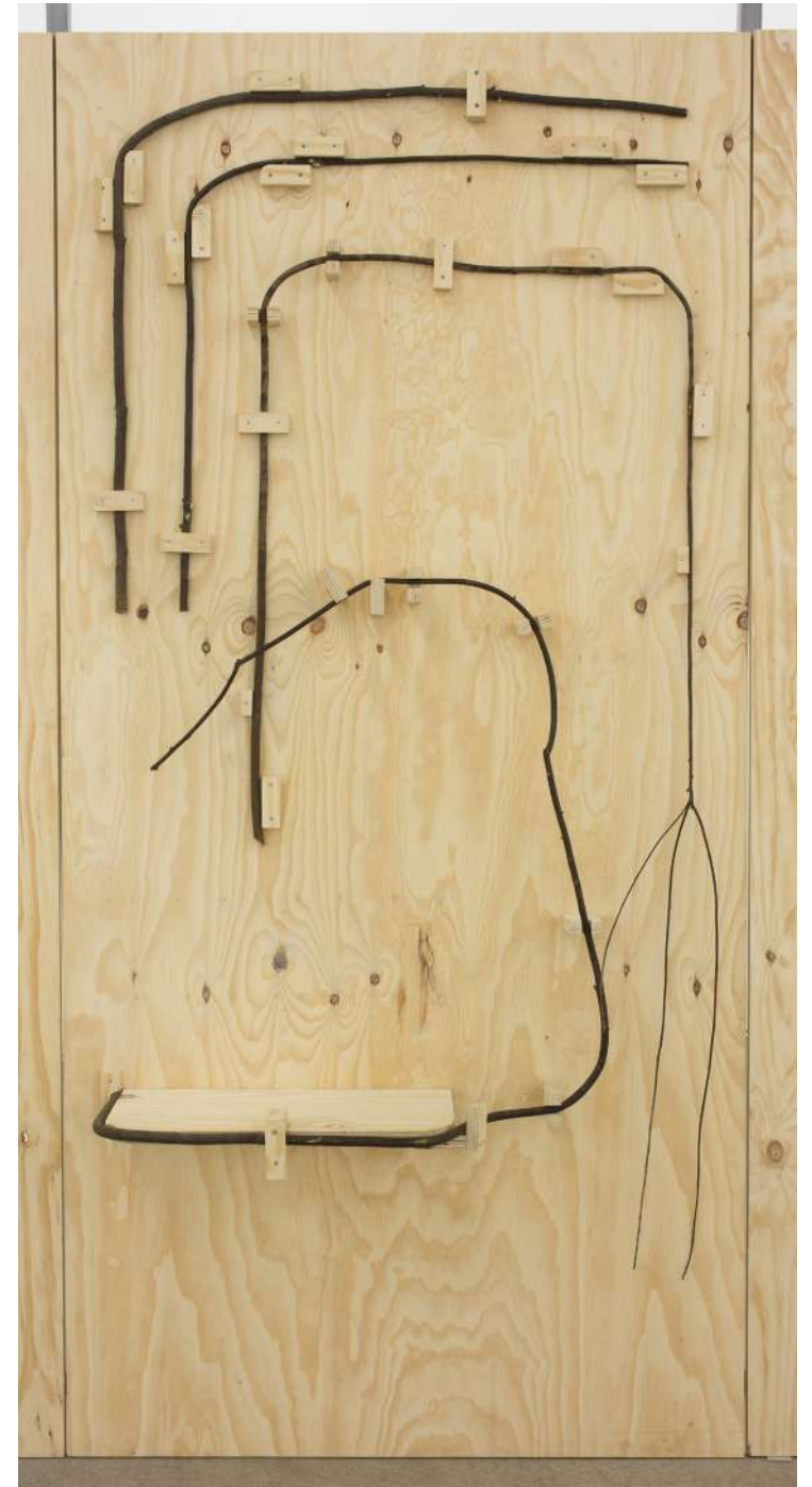
El martinete de Ricardo, 2020 (detalles) Contrachapado de pino y ramas de laurel. 8 elementos de 250 x 125 cm. Medida variable de la instalación.