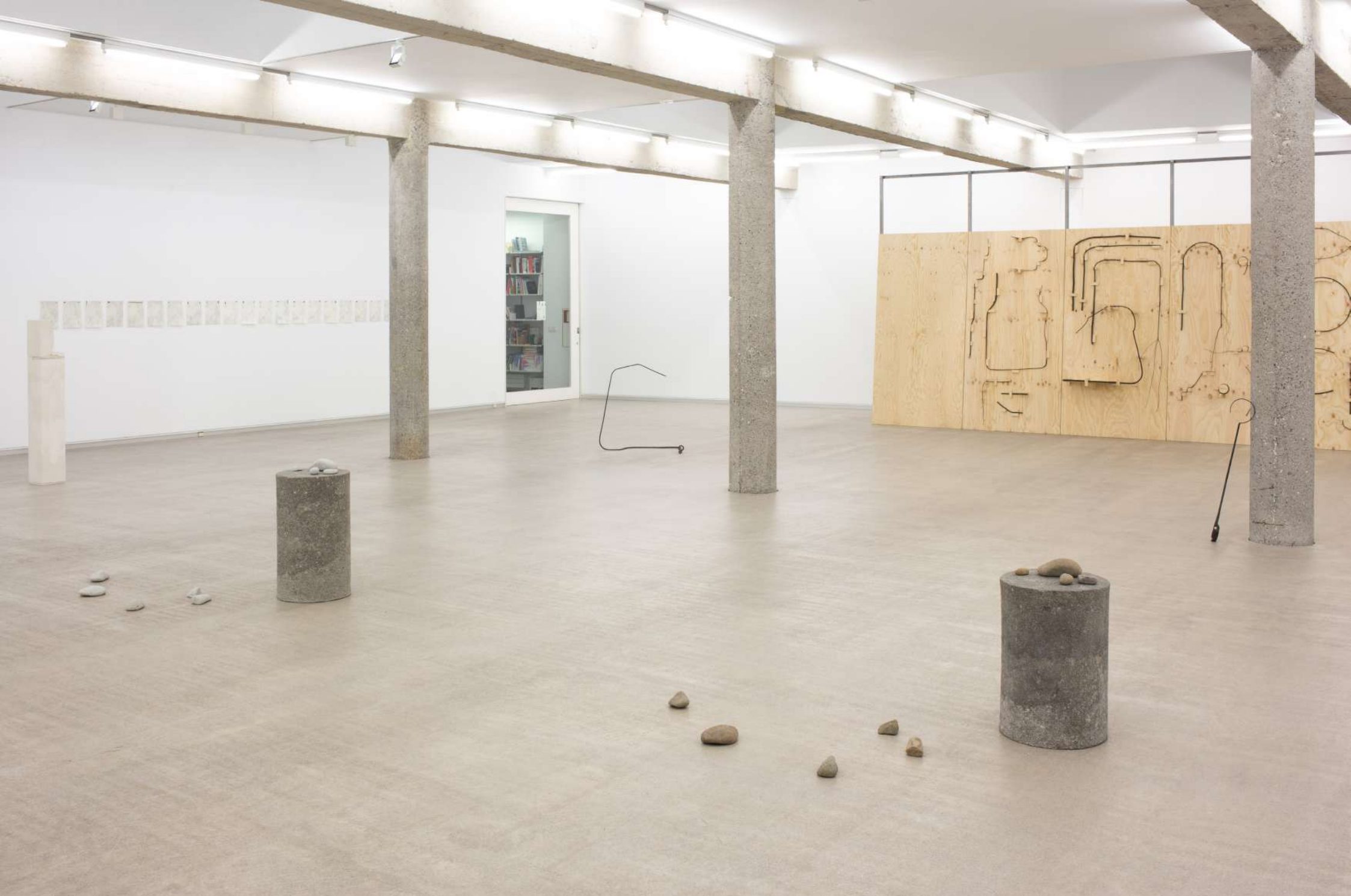
Imagen de instalación