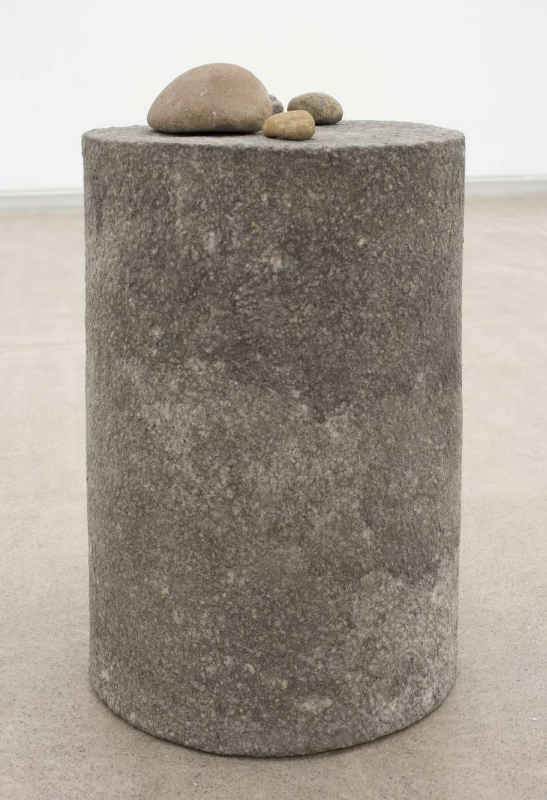
Lo otro (columnas y piedras), 2020 Papel maché, piedras de río, piedras de andesita talladas. (detalle)