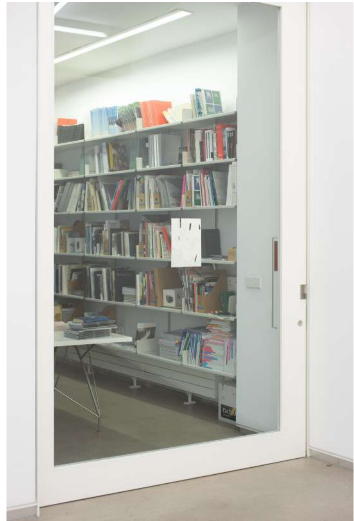
Pelusa (CarrerasMugica), 2020 Lápiz sobre papel, imanes, fragmentos de acero. 29,7 x 21 cm.