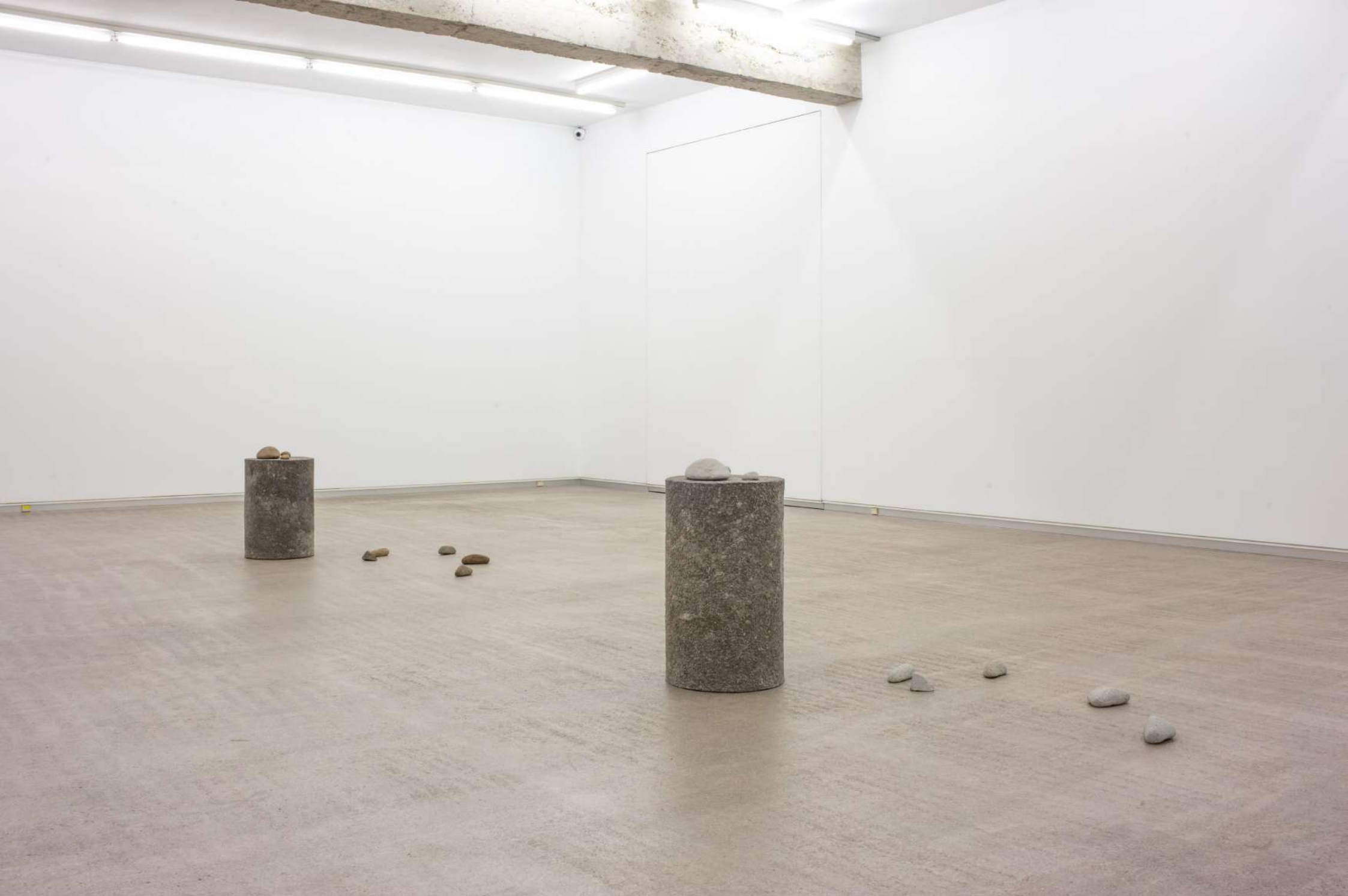
Lo otro (columnas y piedras), 2020

Papel maché, piedras de río, piedras de andesita talladas. 2 elementos (67 x 40 x 40 cm. y 57 x 40 x 40 cm.), medida variable de la instalación.