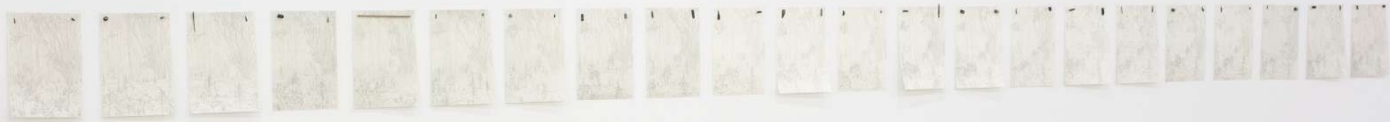
Chamarra negra, sudadera gris, 2020 Políptico 22 dibujos. Lápiz sobre papel, imanes, fragmentos de acero. 29,7 x 21 cm. c/u, medida variable de la instalación.