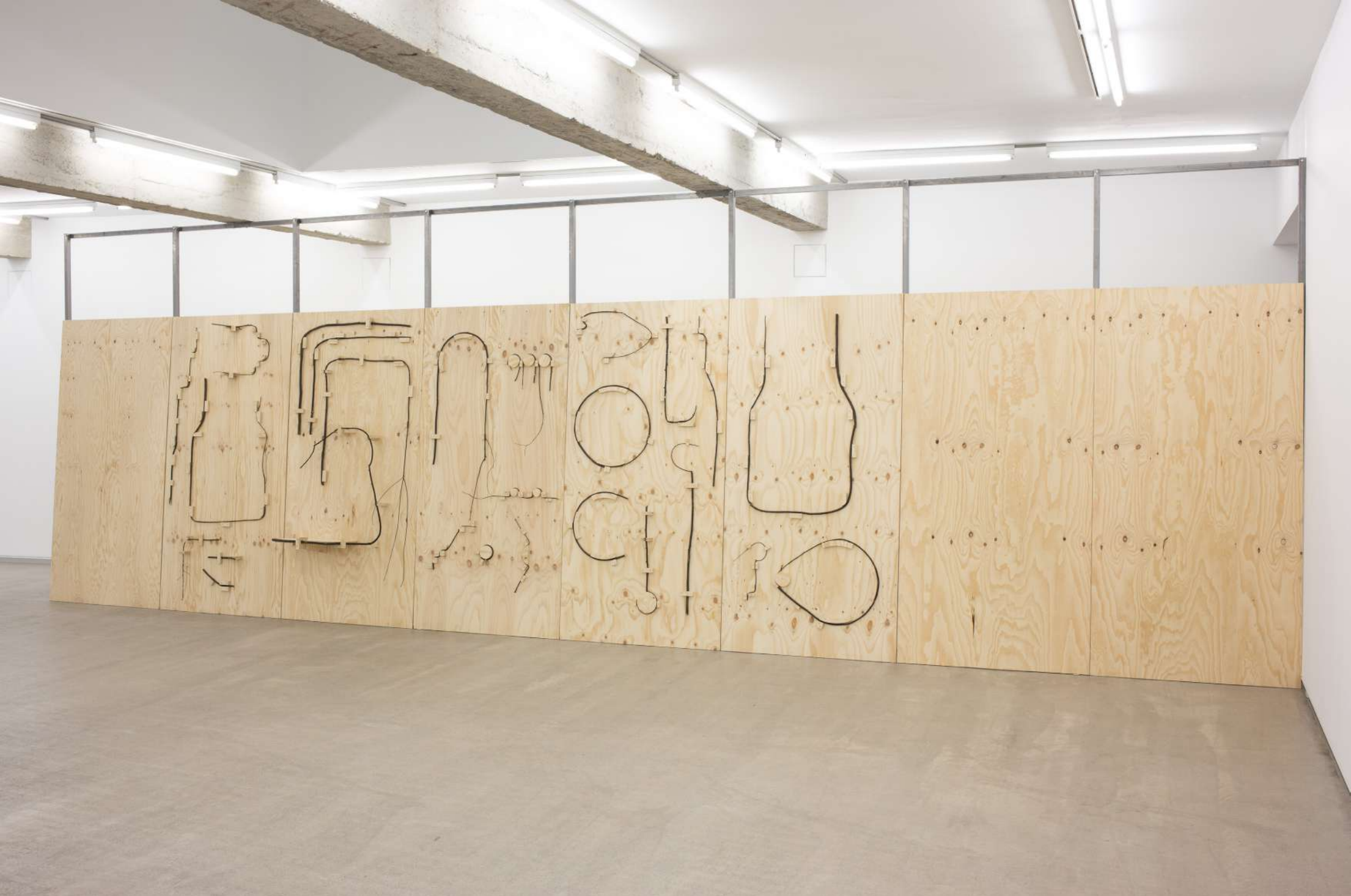
El martinete de Ricardo , 2020 Contrachapado de pino y ramas de laurel. 8 elementos de 250 x 125 cm. Medida variable de la instalación.