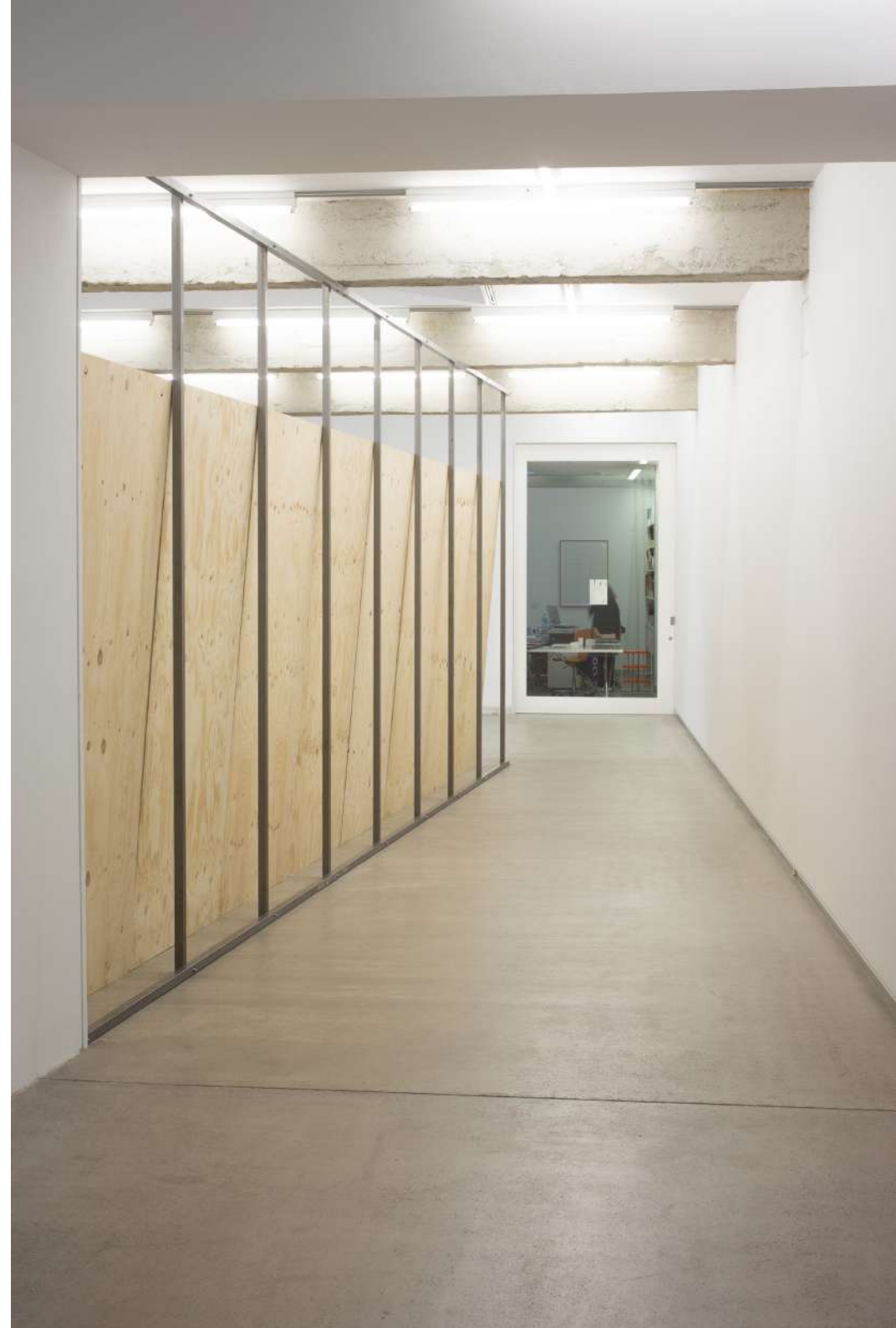
Imagen de instalación