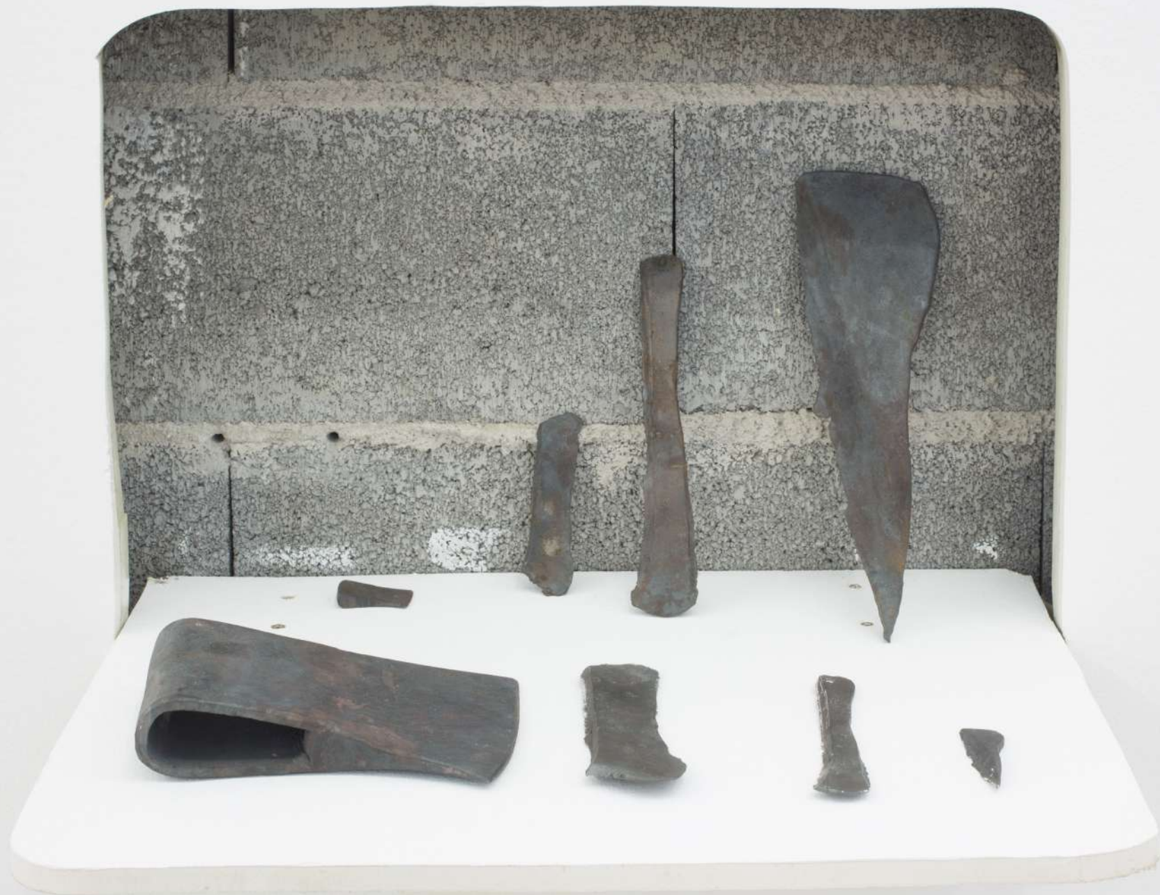
Hachita , 2020 Acero forjado y fundición en acero. 8 elementos. 37 x 53 x 37 cm.