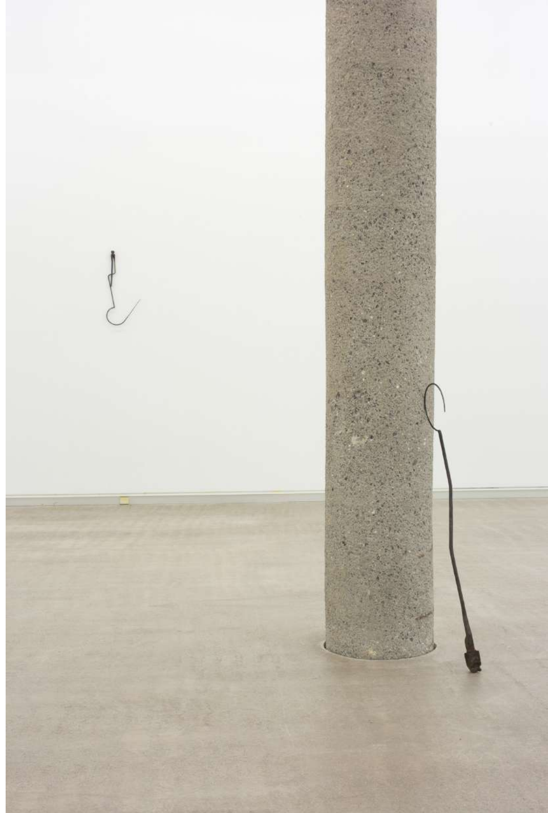
Bellota (2) , 2020 Acero forjado. 50 x 24 x 3 cm.