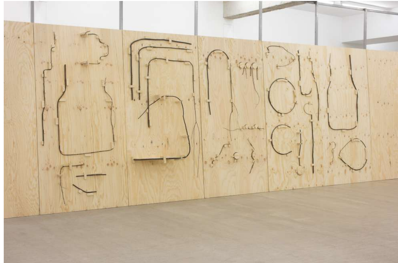
El martinete de Ricardo, 2020 (detalles) Contrachapado de pino y ramas de laurel. 8 elementos de 250 x 125 cm. Medida variable de la instalación.