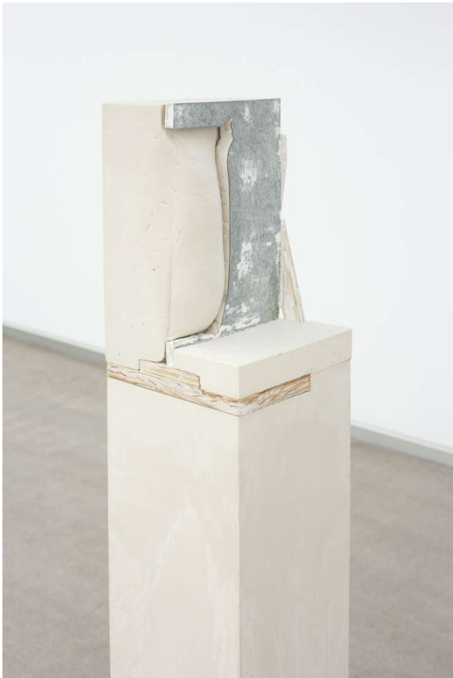
Tarraja , 2020 Escayola, madera, lámina de aluminio. 146 x 22,5 x 22 cm.