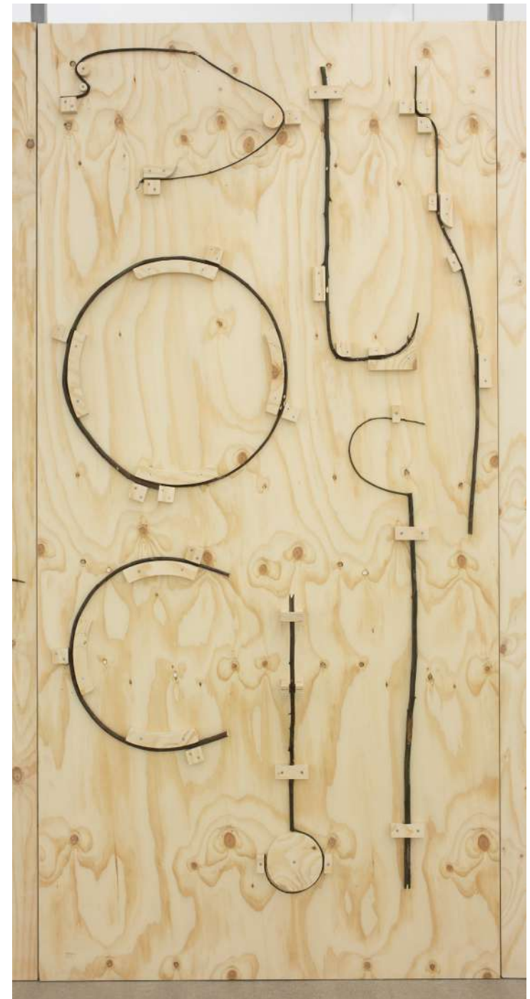
El martinete de Ricardo, 2020 (detalles) Contrachapado de pino y ramas de laurel. 8 elementos de 250 x 125 cm. Medida variable de la instalación.