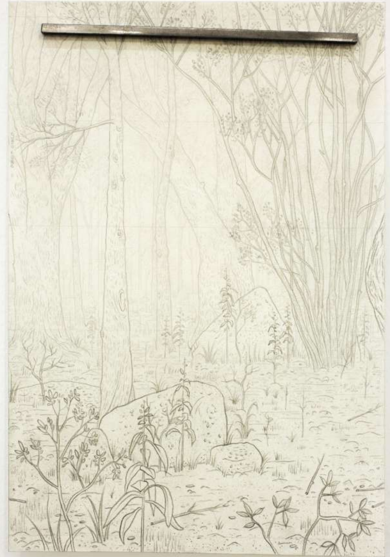
Chamarra negra, sudadera gris, 2020 Políptico 22 dibujos. Lápiz sobre papel, imanes, fragmentos de acero. 29,7 x 21 cm. c/u, medida variable de la instalación. (detalles)