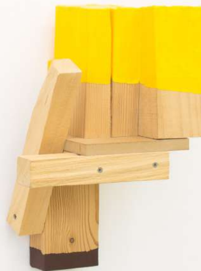
Saludo , 2019 Construcción en madera y pintura. 40 x 23 x 24,5 cm