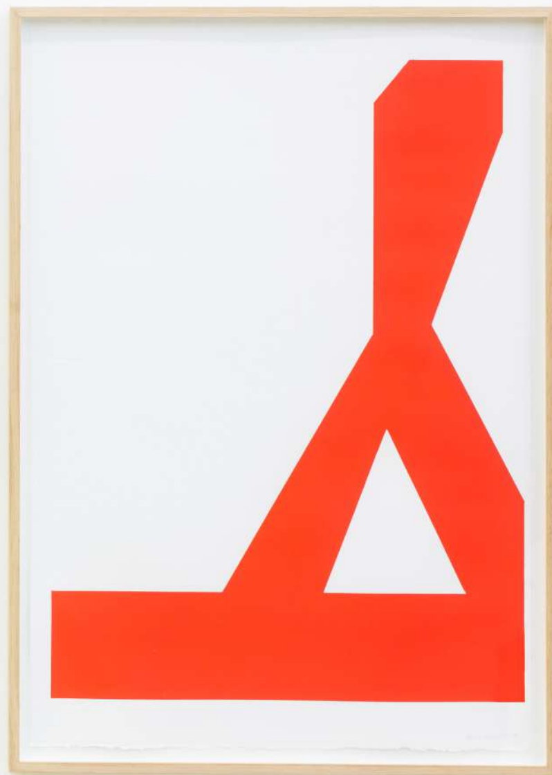
Sólido II, 2019 Pintura sobre papel. 100 x 70 cm.