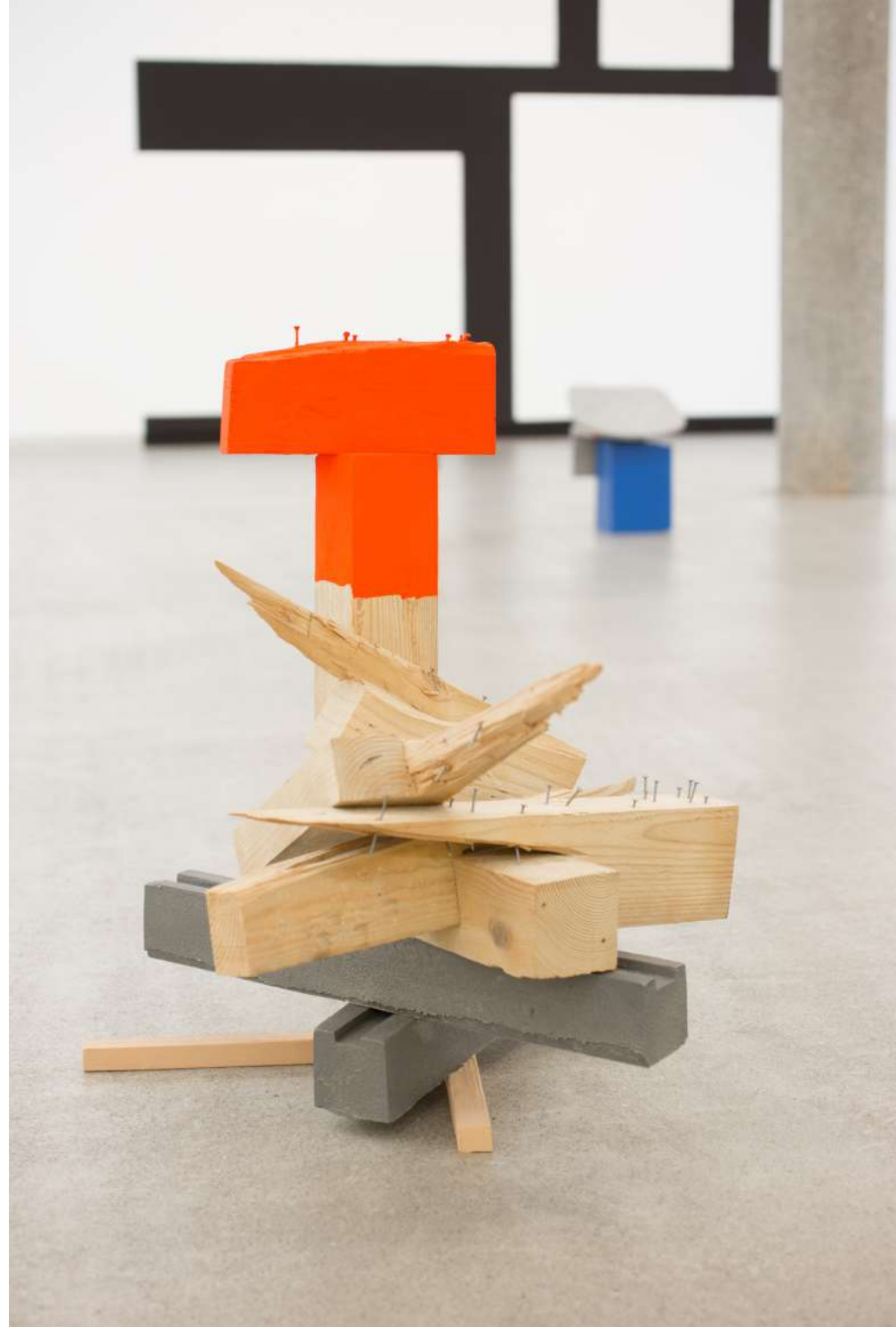
Dardara , 2019. Elementos de aluminio fundidos y soldados, madera, clavos, pintura. 60 x 60 x 64 cm.