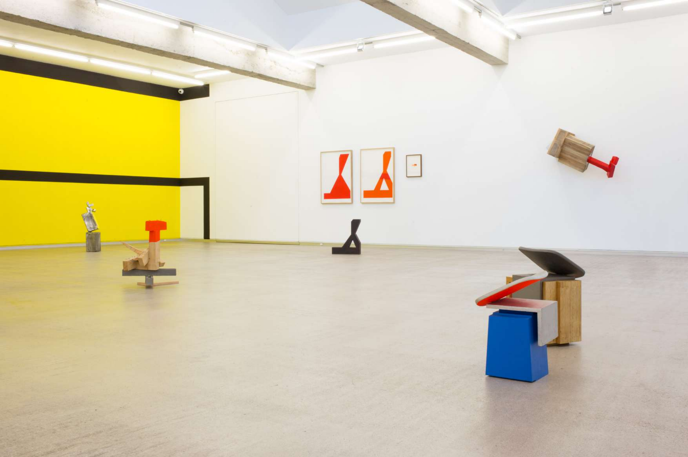
Imagen de instalación