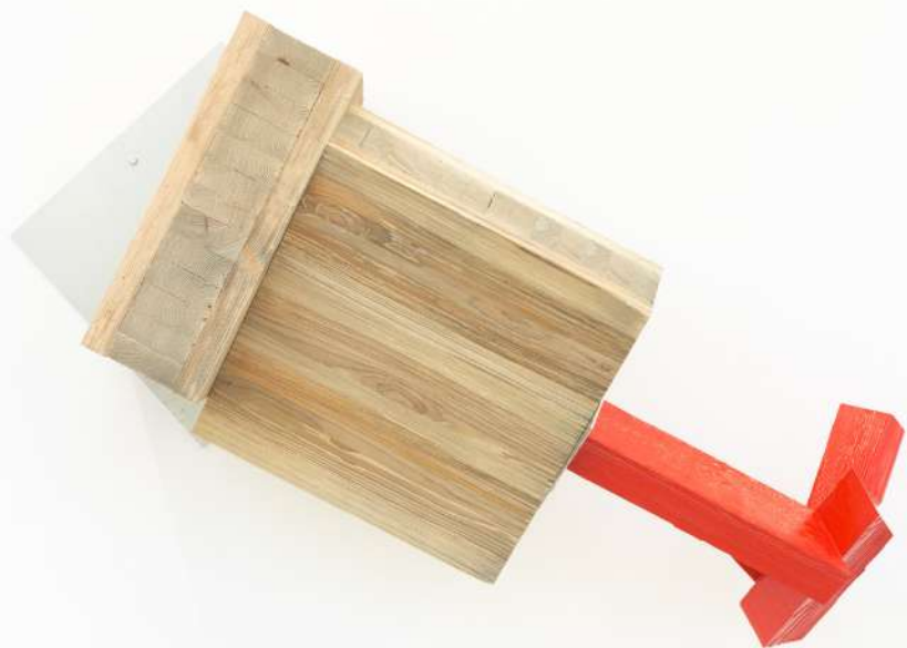
Sin título, 2019. Construcción en madera y acero galvanizado y pintura. 85 x 120 x 46 cm.