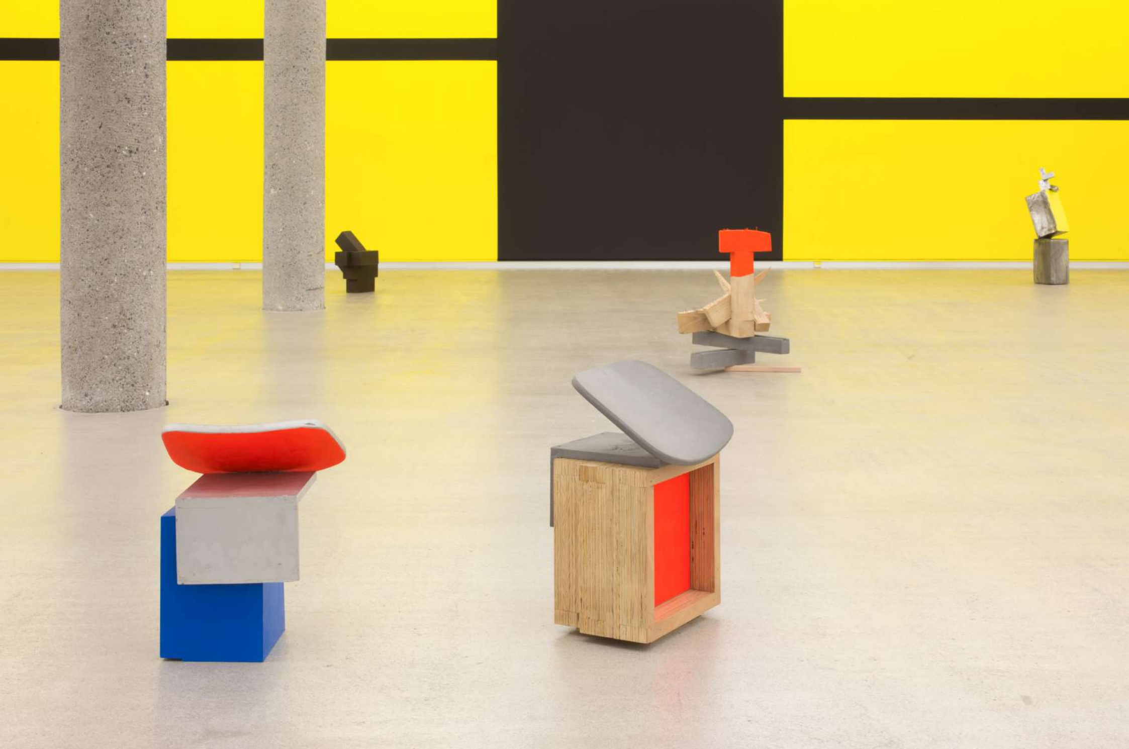
Imagen de instalación