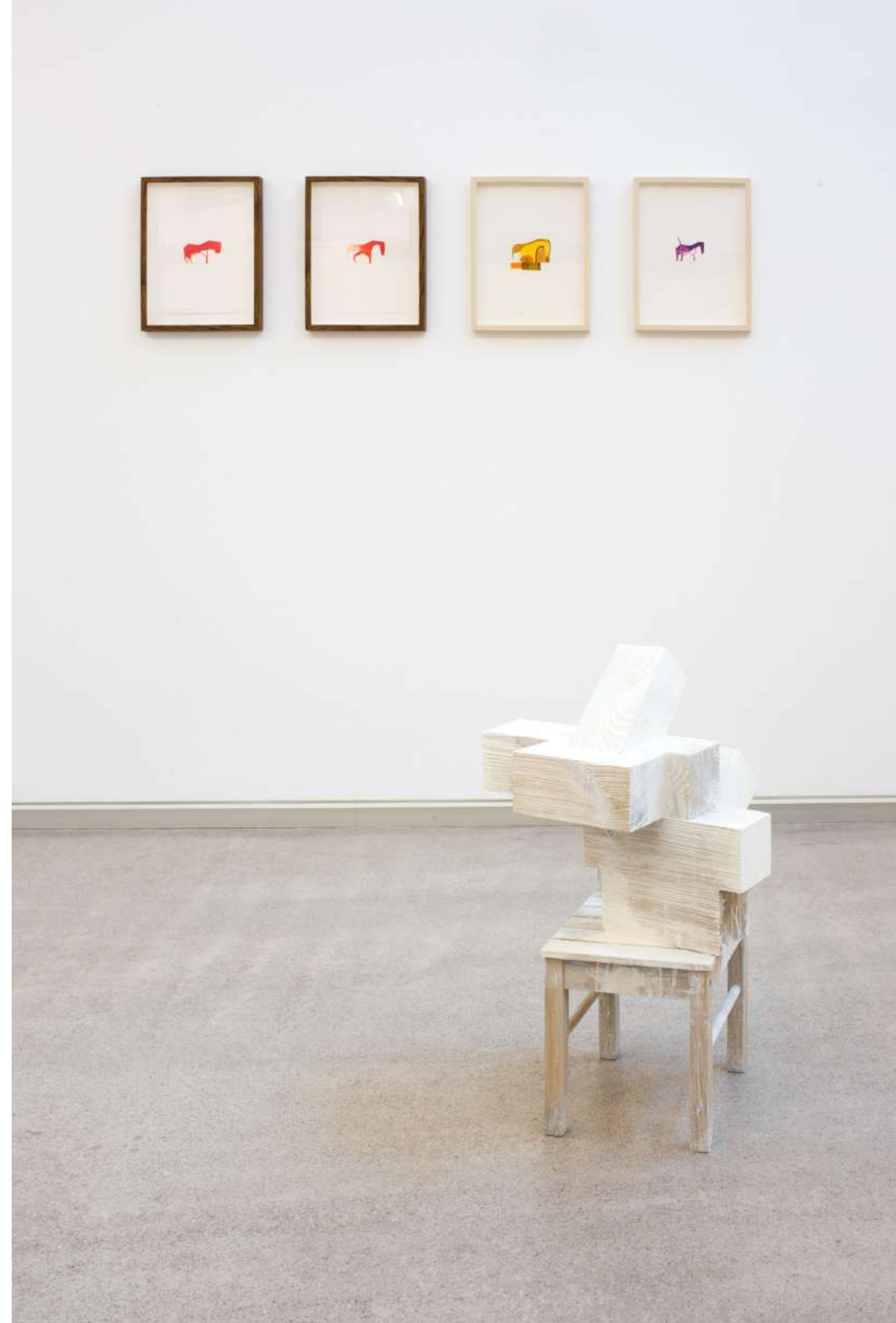
Imagen de instalación