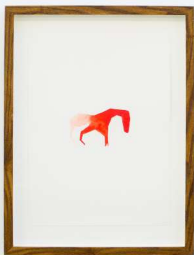
Bestiario II , 2019 Acuarela sobre papel. 40 x 30 cm.