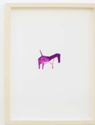
Bestiario V , 2019 Acuarela sobre papel. 40 x 30 cm.