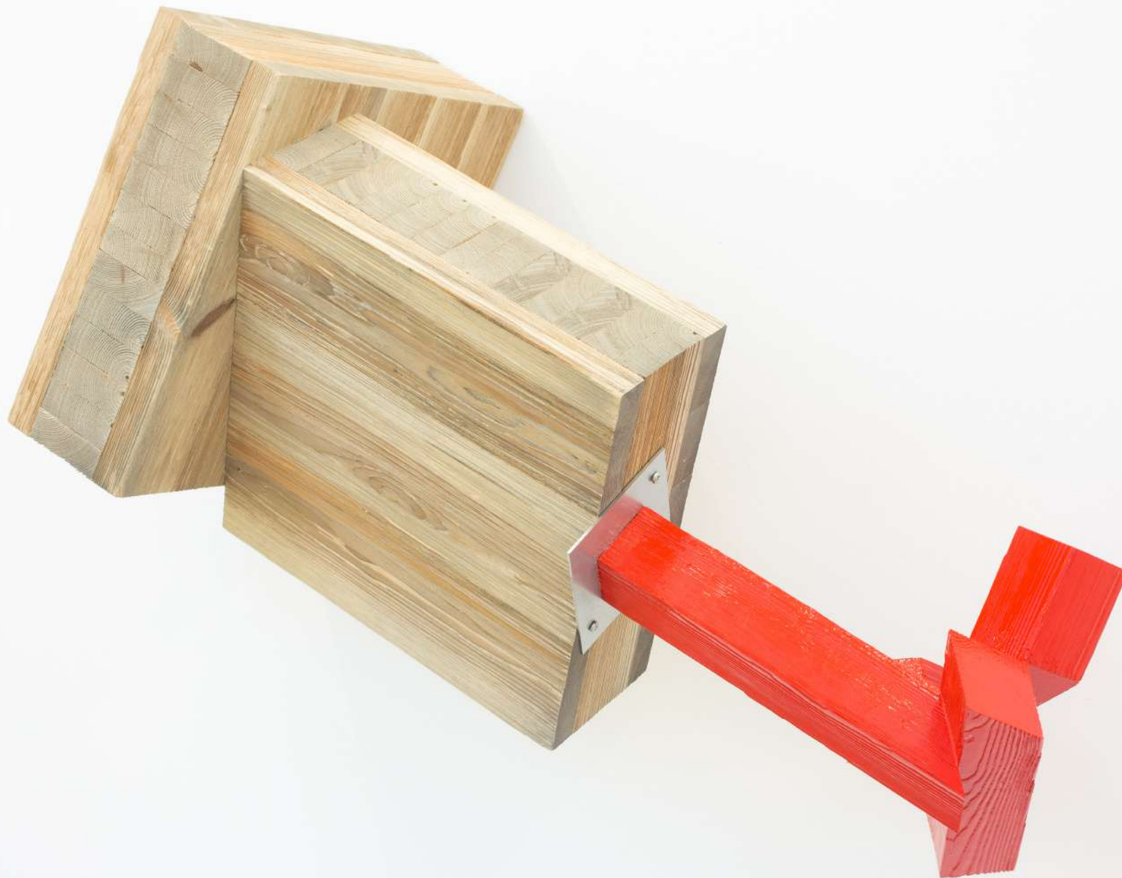
Sin título, 2019. Construcción en madera y acero galvanizado y pintura. 85 x 120 x 46 cm.