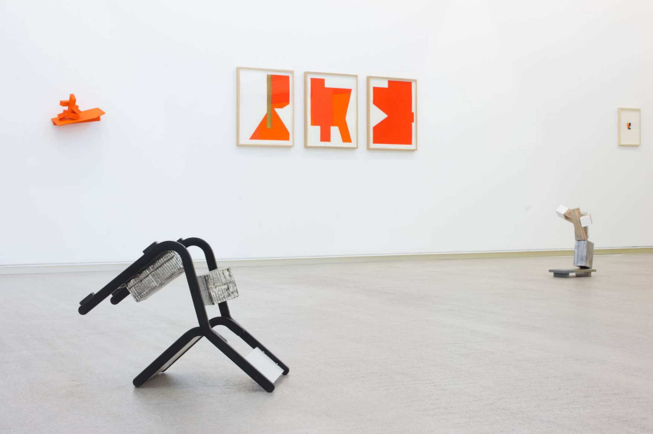
Imagen de instalación