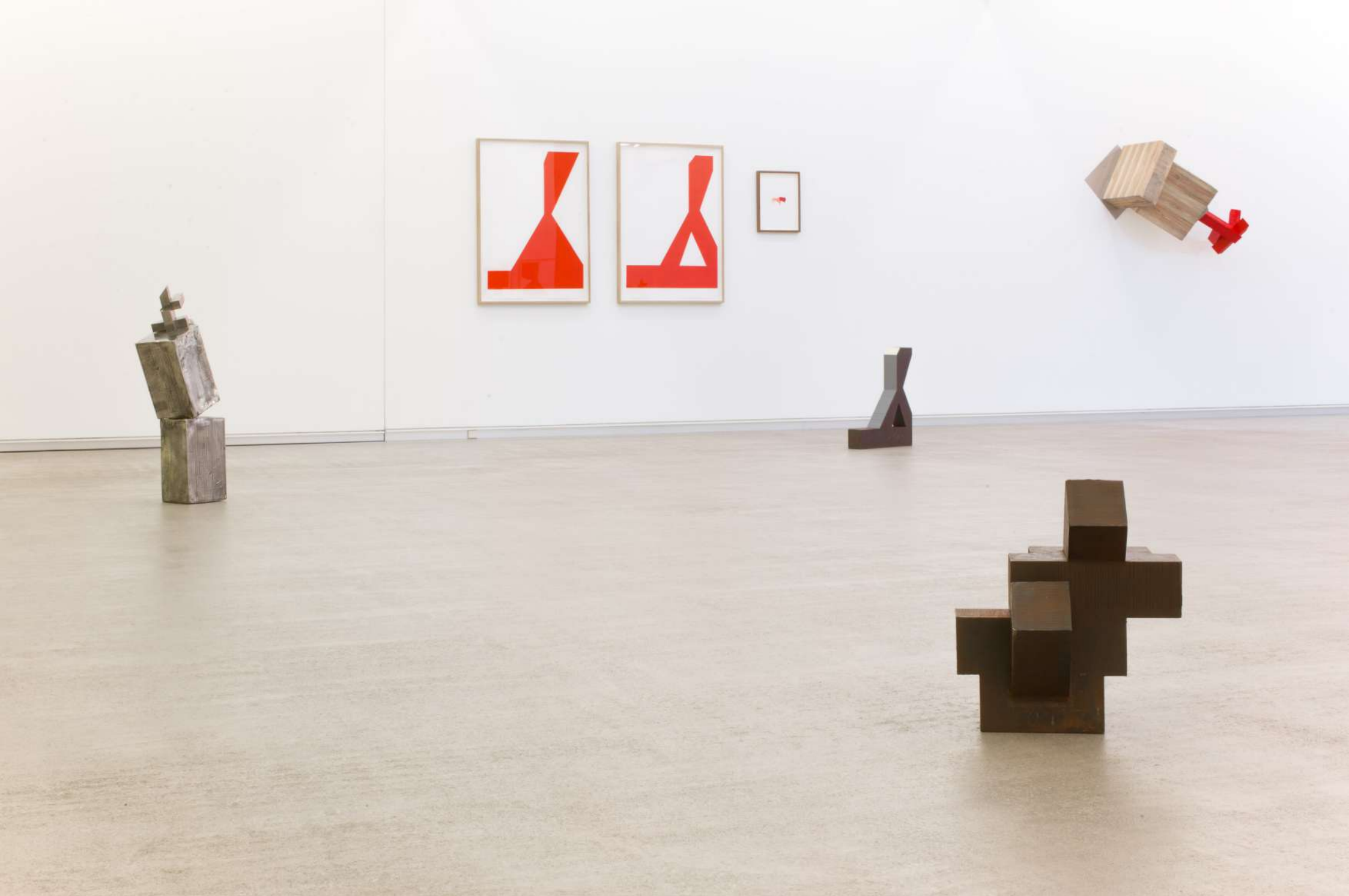
Imagen de instalación