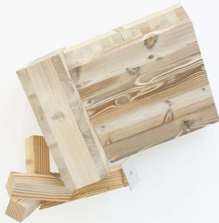
Sin título, 2019. Construcción en madera y acero galvanizado. 85 x 80 x 45 cm.