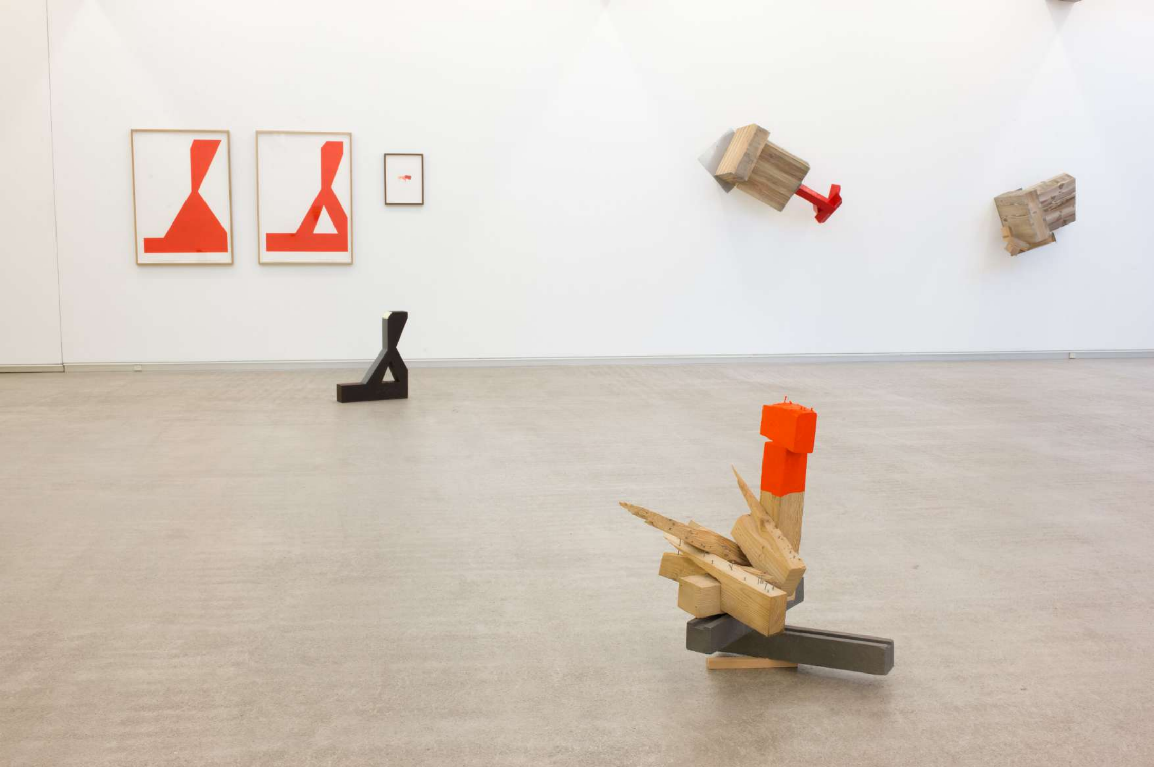
Imagen de instalación