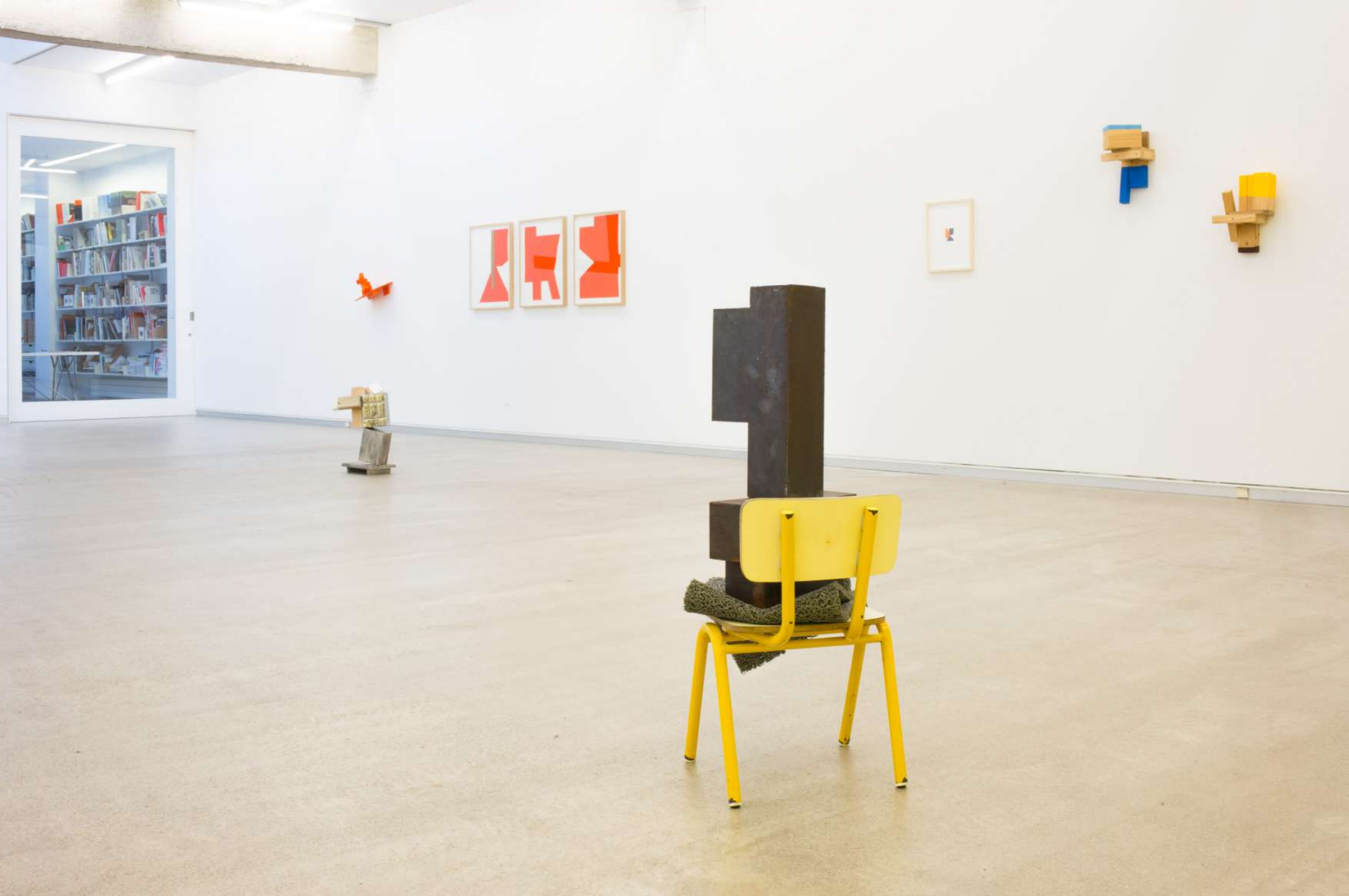
Imagen de instalación