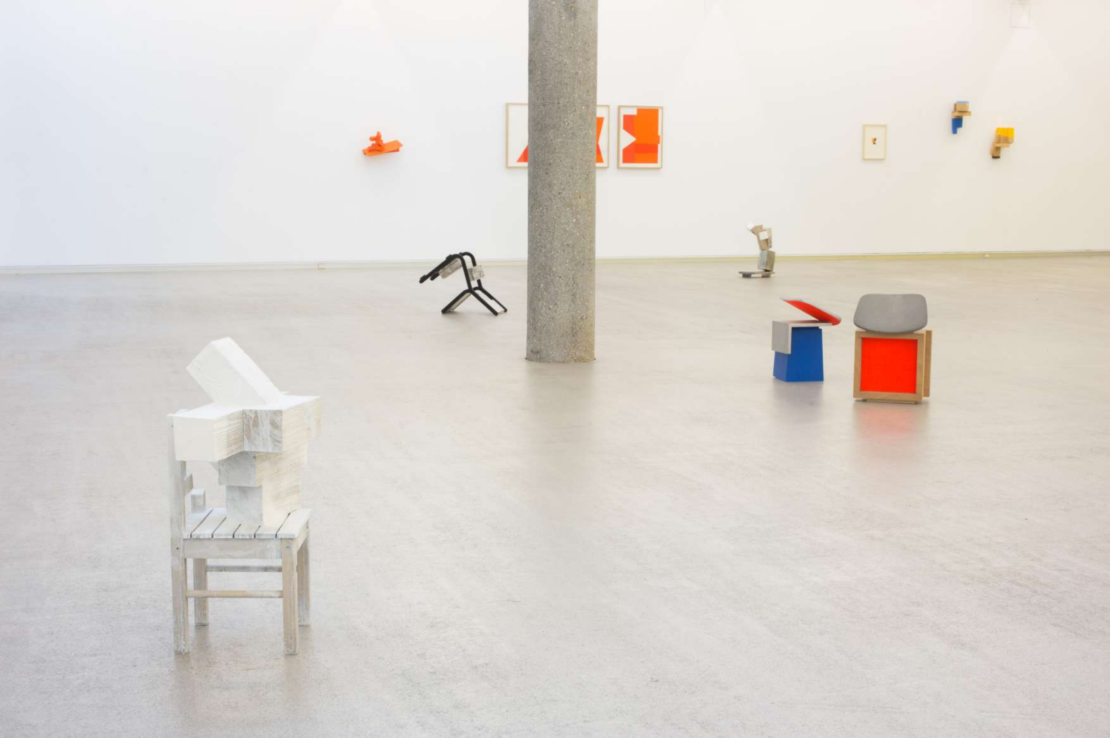
Imagen de instalación