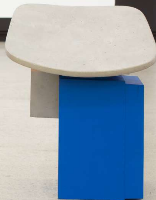
Mutante I , 2019 Elementos de aluminio fundidos y soldados, madera y pintura. 45 x 35 x 29 cm.