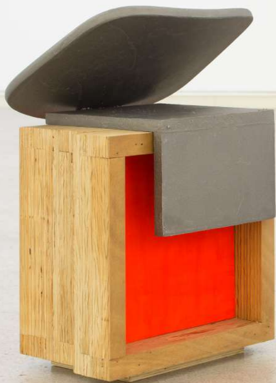
Mutante II , 2019 Contrachapado, elementos de aluminio soldados y pintura. 53 x 37 x 28 cm.