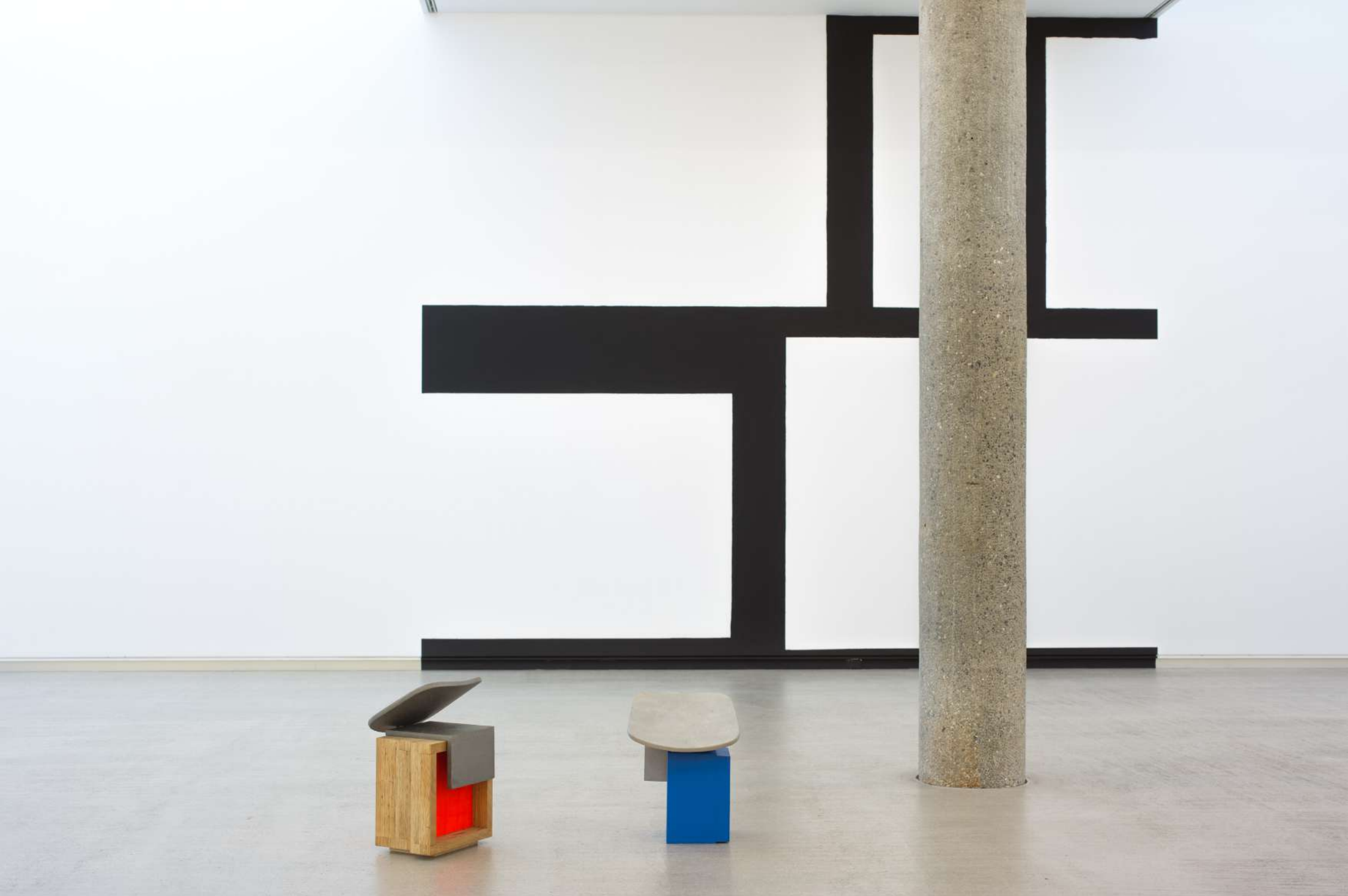
Imagen de instalación