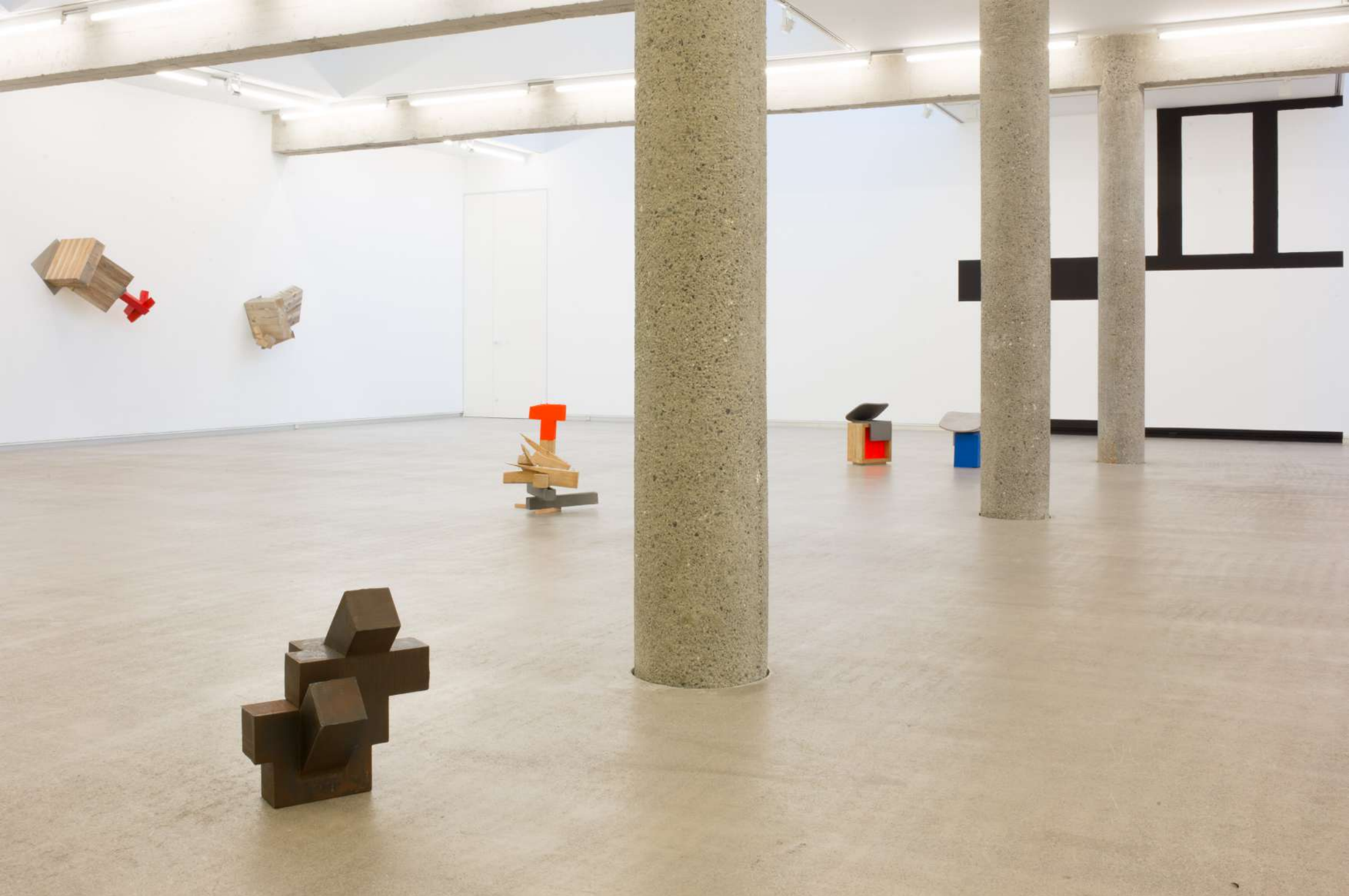
Imagen de instalación