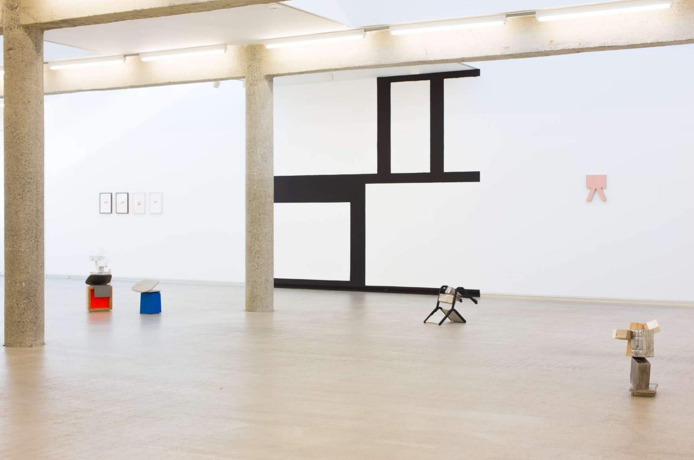
Imagen de instalación