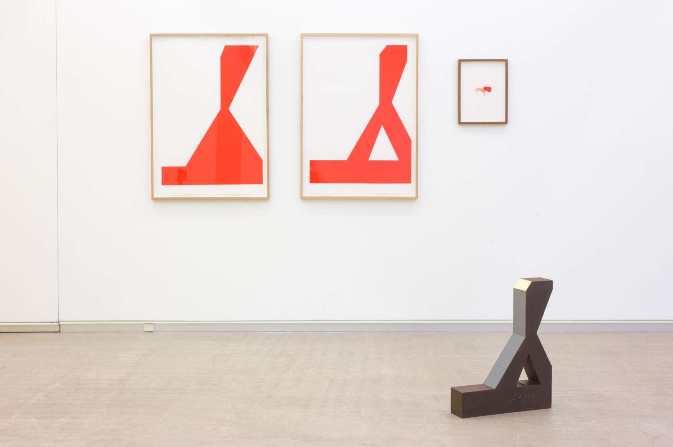
Imagen de instalación