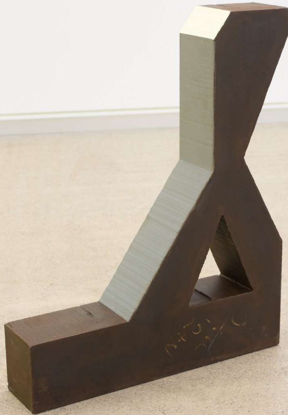
Sólido, 2019 Hierro y pintura. 58,5 x 47 x 18 cm.