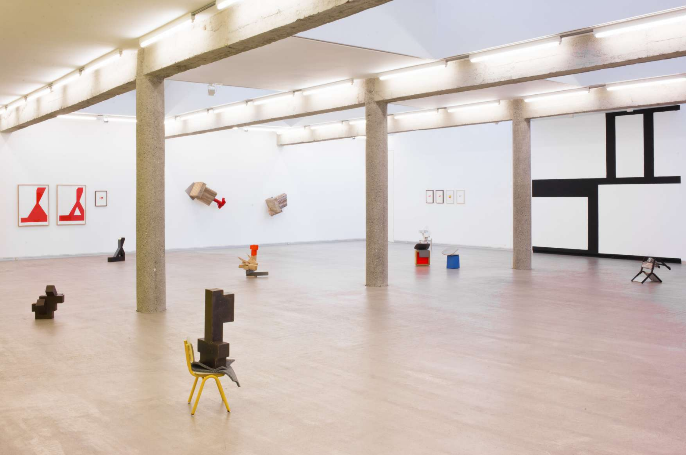
Imagen de instalación