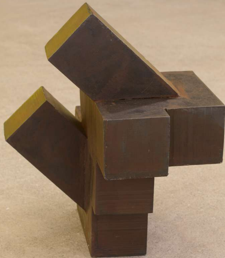
Bikote , 2019 Hierro. 44 x 39 x 38 cm.